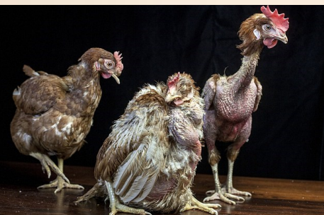
Zeer mager en zwak, uitgemergeld, borstbeen scherp te voelen