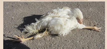
Kan niet opstaan of bewegen omwille van fysieke afwijking of letsel