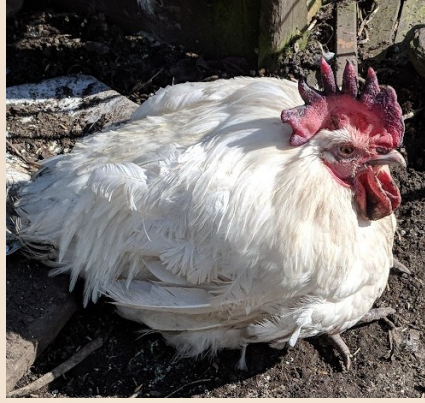
Donker rode, paarse, zwarte kam en lellen