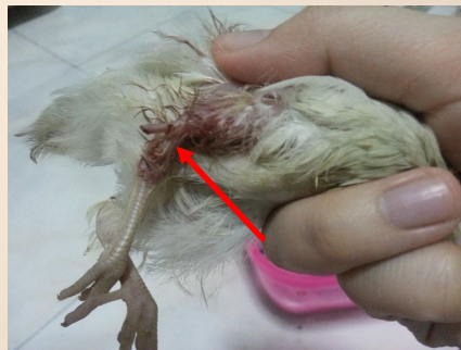
Ontwricht, gebroken, uitstekend bot