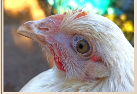
Vocht of etterige uitvloei van ogen of neus