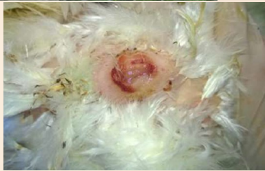
Prolaps of bloed uit de cloaca