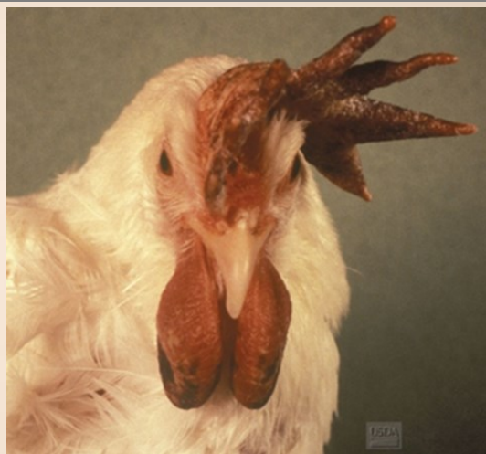
Aangifte plichtige ziekten: Aviaire influenza