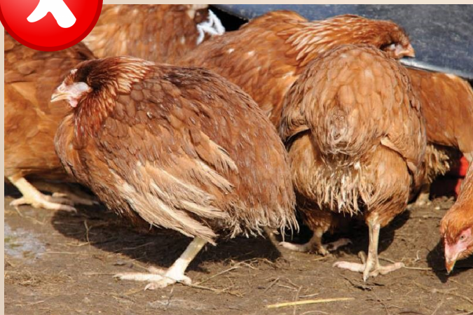
Toom in slechte toestand