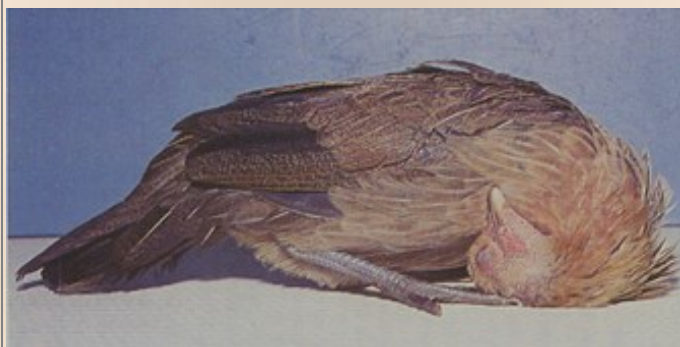
Newcastle Disease - Draainek