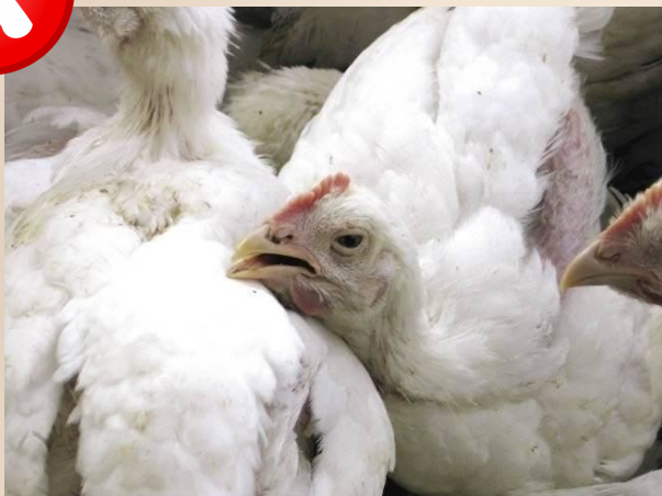
Toom in slechte toestand