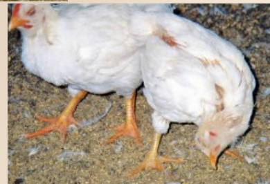
Newcastle Disease - Draainek