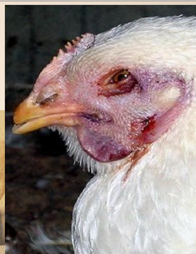
Aangifte plichtige ziekten: Aviaire influenza